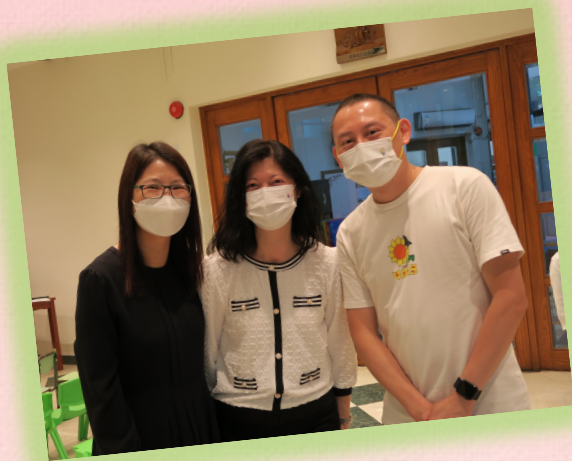
本校與友校共同參與 生命教育活動