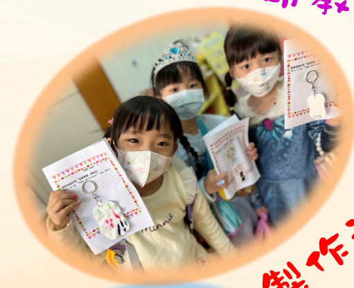
製作溫度標 鑰匙扣