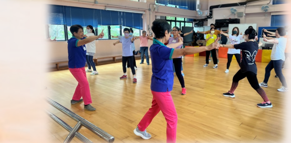
學校與教會舉辦讚美操班