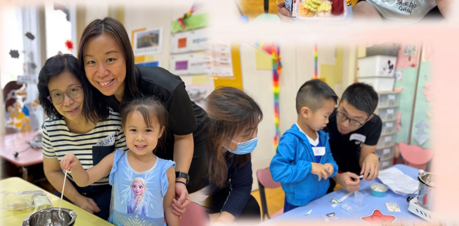
三代同堂製作蚊膏