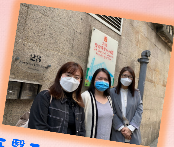
牙醫到校為幼兒檢查 牙齒，並與校長交流 護齒的方法