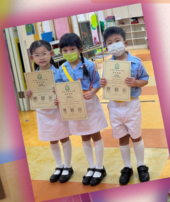
本園重視幼兒的道路安 全意識，透過活動推廣 道路安全的重要性。