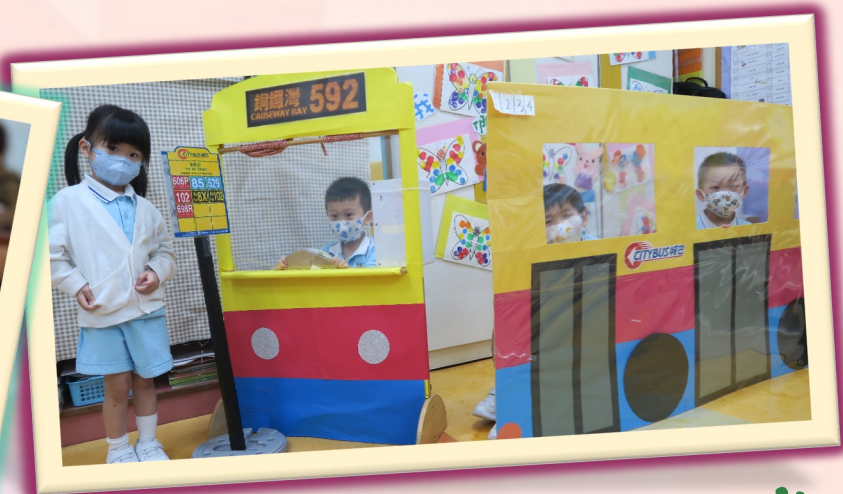
下一站:北角聖彼得堂