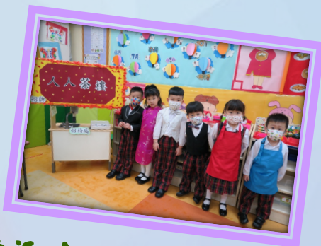
歡迎光臨「人人茶樓」